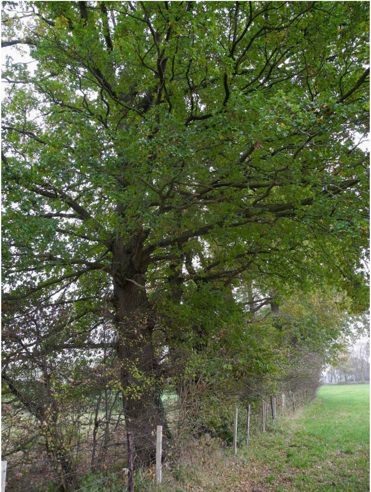
Abbildung 8: Beispiel Alteiche (>200 Jahre) in der o.g. Strauch-Baumhecke mit Totholz und Astausfaulungen