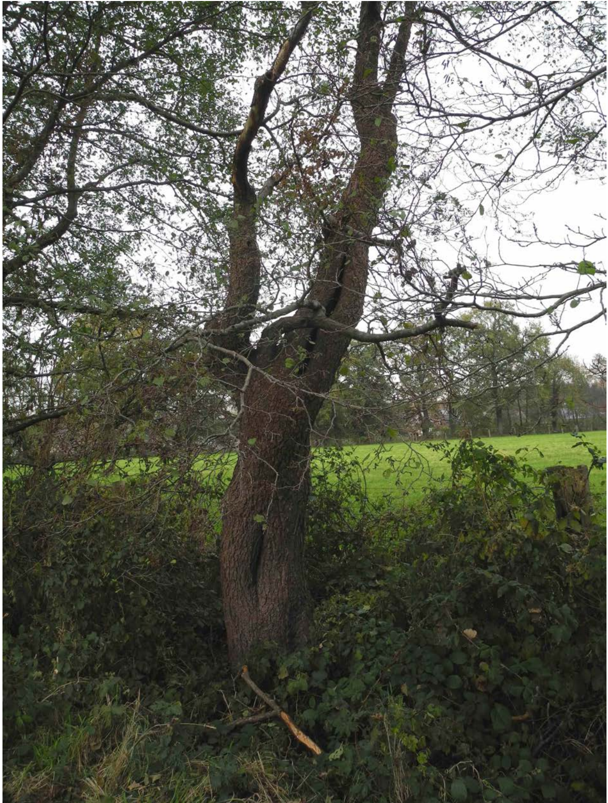
Abbildung 9: Beispiel Altbaum Erle mit potenziellen Fledermausquartieren für baumbewohnende Arten und umgebende Strauchvegetation (Brombeere) im Wegesaum der Zuwegung und westlichen Grenze des Plangebiets