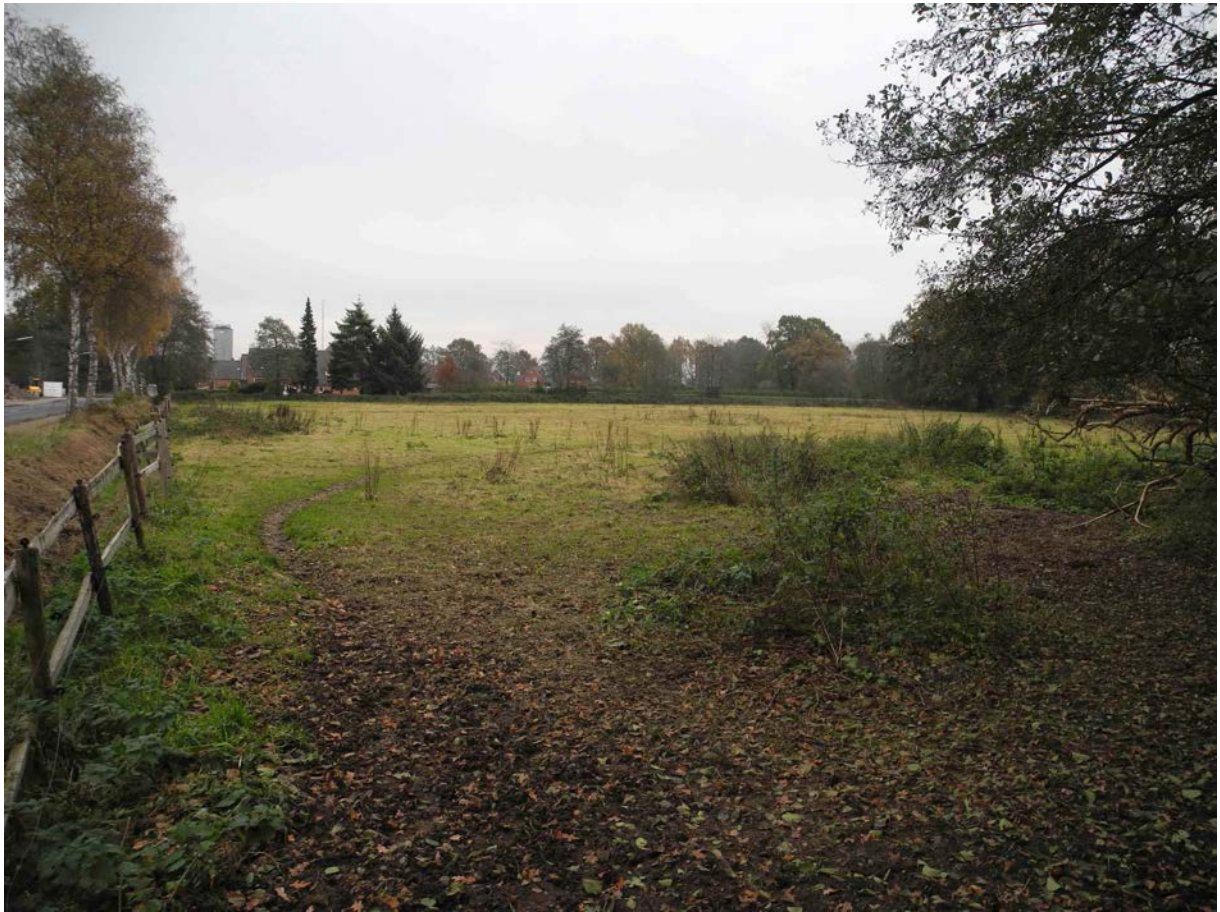
Abbildung 5: Viehweide/Pferdekoppel. Blick von West