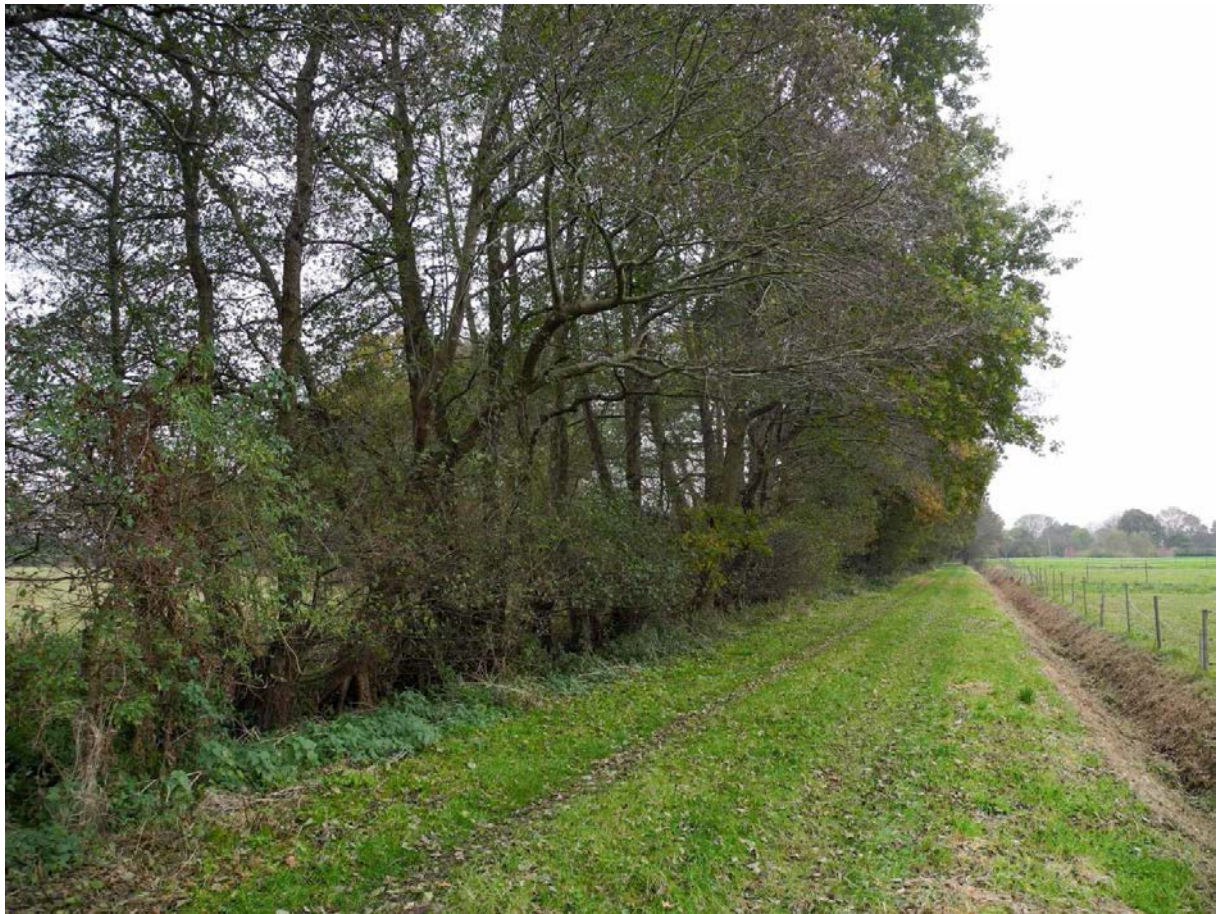
Abbildung 6: Zuwegung in Nord-Süd-Richtung an der westlichen Grenze des Plangebiets