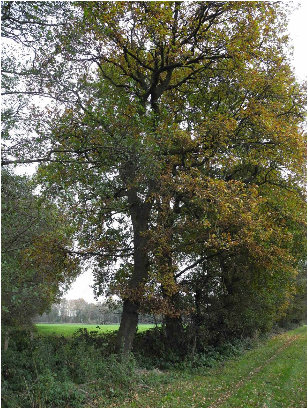
Abbildung 7: Überplante Strauch-Baumhecke auf der südlichen Plangebietsgrenze