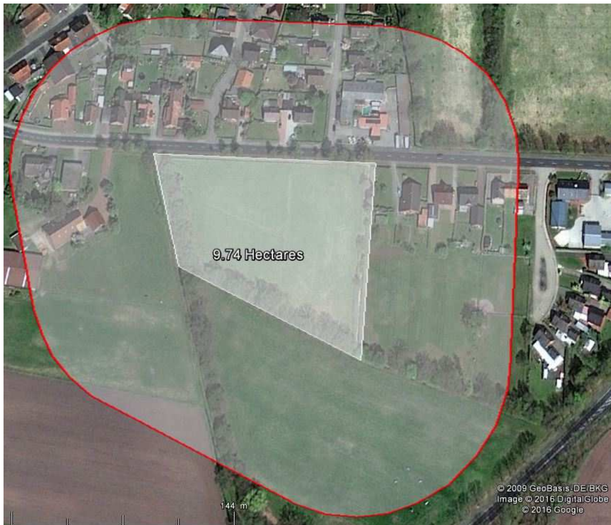
Abbildung 2: Satellitenbild des Untersuchungsgebiets (roter Rahmen) und des Plangebiets (hell unterlegt, weiß umrandet)